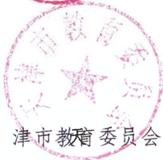
天津市教育委员会