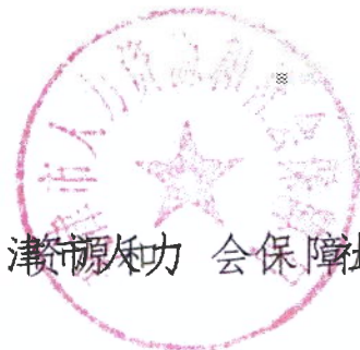
天津市人力资源和社会保障局