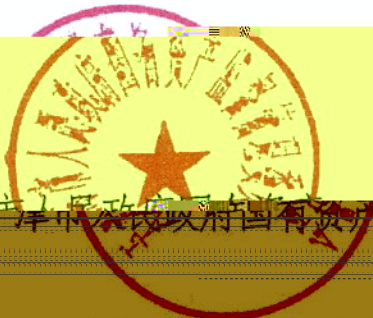
天津市人民政府国有资产监督管理委员会