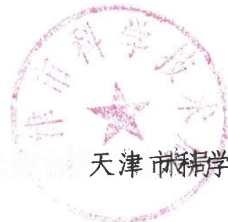
天津市科学技术局